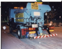
▲ 凍結防止剤の夕方散布