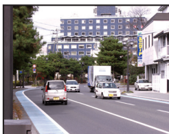
▲ 自転車走行空間の明確化