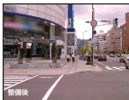
▲ 歩道のバリアフリー化