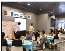
▲ 地下通路のイベント活用