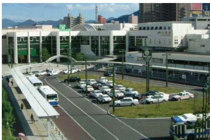
駅前広場（JR手稲駅北口）

これまで、駅を中心とする交通結節点には、徒歩、自転車、バスや自家用車などの自動車など多くの交通が集中することから、複数の交通手段の乗継が円滑に行えるよう駅前広場やバスターミナルなどの整備を進めてきました。