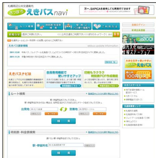
図4-17 えきバス・ナビ（ホームページ）

今後、ICカードの導入による利便性の向上やバリアフリー化された移動経路の確保とあわせて、適切な案内表示や国際化に対応した外国語標記などにより、利用者の視点に立ち、「わかりやすさ」「使いやすさ」を重視し、連携強化を進めることが重要です。