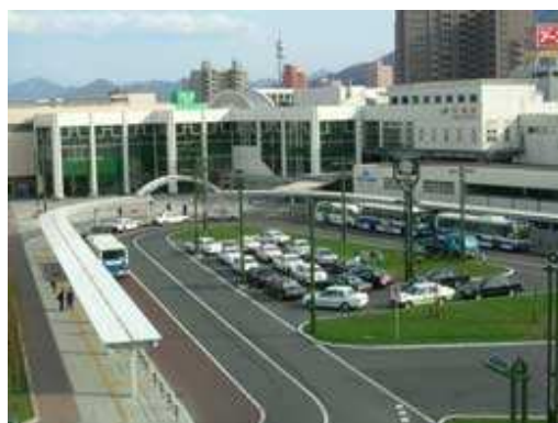
駅前広場(JR手稲駅北口)

これまで、駅を中心とする交通結節点には、徒歩、自転車、バスや自家用車などの自動車など多くの交通が集中することから、複数の交通手段の乗継が円滑に行えるよう駅前広場やバスターミナルなどの整備を進めてきました。