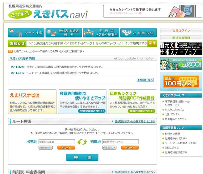
図 4-16 えきバス・ナビ（ホームページ）

今後、ICカードの導入による利便性の向上やバリアフリー化された移動経路の確保とあわせて、適切な案内表示や国際化に対応した外国語標記などにより、利用者の視点に立ち、「わかりやすさ」「使いやすさ」を重視し、連携強化を進めることが重要です。