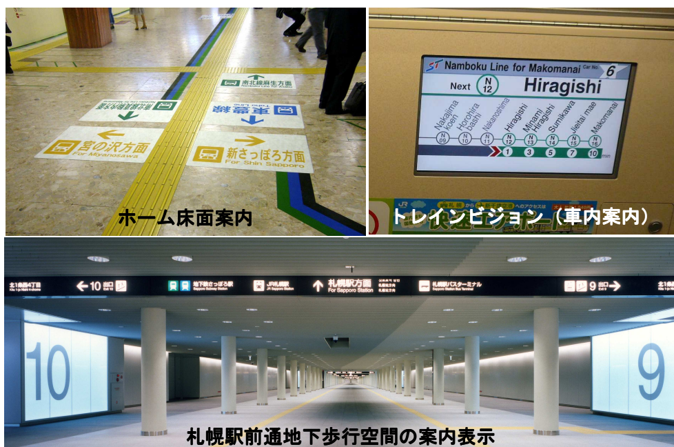
図 4-17 案内表示の事例