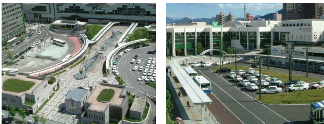
駅前広場（左：JR札幌駅北口、右：JR手稲駅北口）

これまで、駅を中心とする交通結節点には、徒歩、自転車、バスや自家用車などの自動車など多くの交通が集中することから、複数の交通手段の乗継が円滑に行えるよう駅前広場やバスターミナルなどの整備を進めてきました。