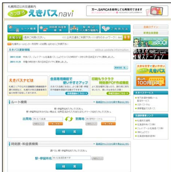
図 4-17 えきバス・ナビ（ホームページ）

今後、ICカードの導入による利便性の向上やバリアフリー化された移動経路の確保とあわせて、適切な案内表示や国際化に対応した外国語標記などにより、利用者の視点に立ち、「わかりやすさ」「使いやすさ」を重視し、連携強化を進めることが重要です。