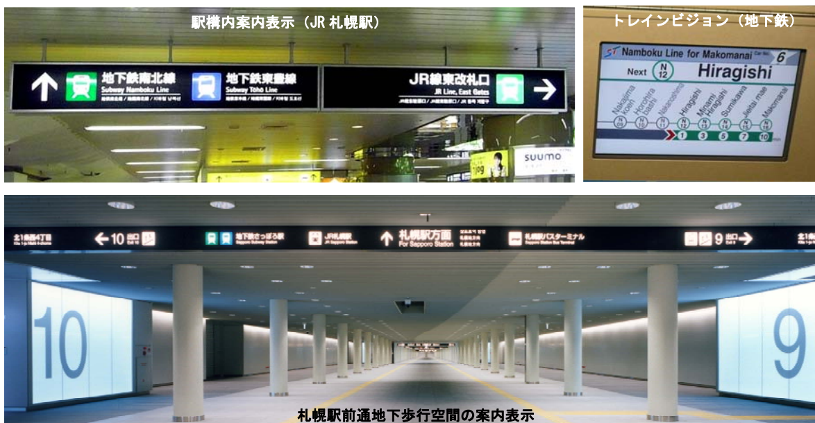
札幌駅前通地下歩行空間の案内表示