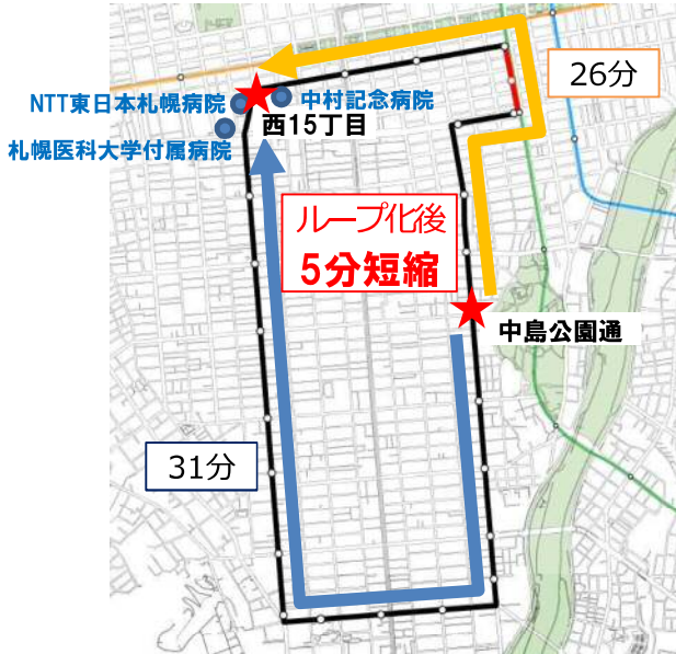
※4 移動時間は路面電車ループ化前後の時刻表より集計。