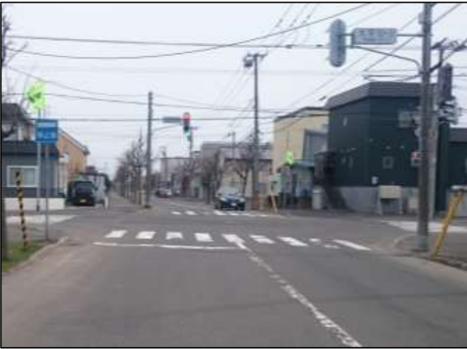
【変更箇所写真】 交差点の西側から撮影