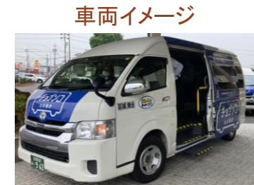
※他都市の運行車両