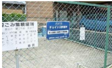
他都市の事例(ゴミステーション)

乗車ポイント 既存バス停、ゴミステーション・電柱 町内施設・商業施設、病院などを想定