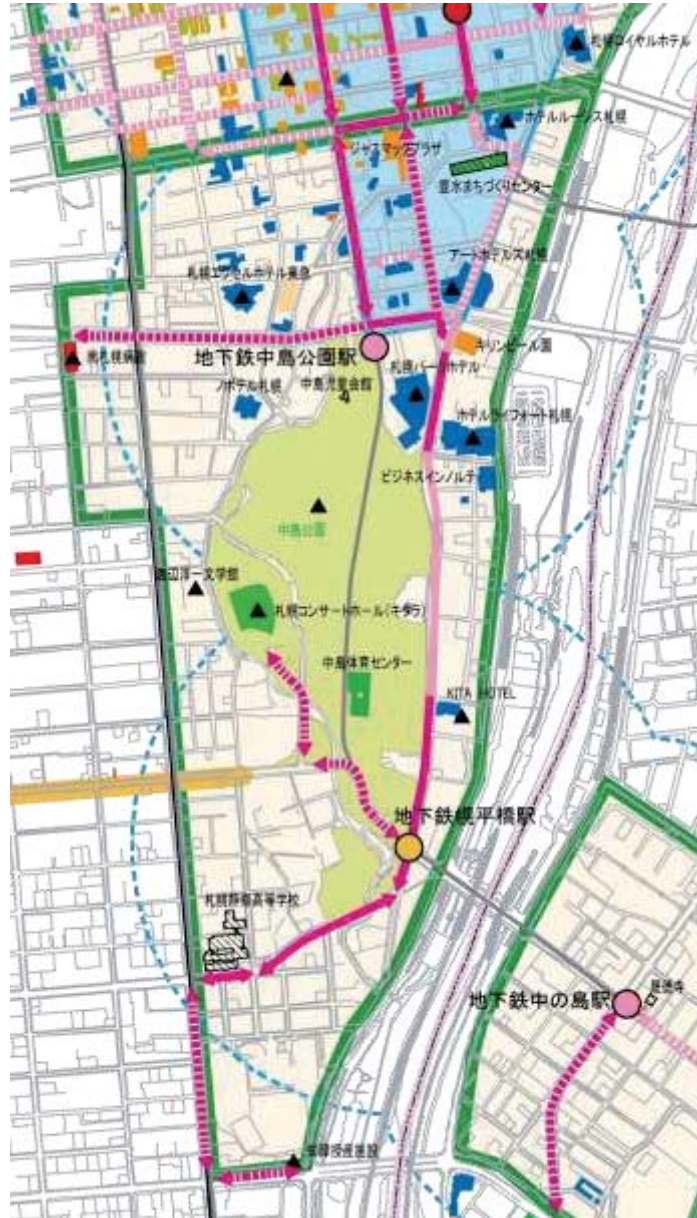
図 2-18 中島公園・幌平橋地区