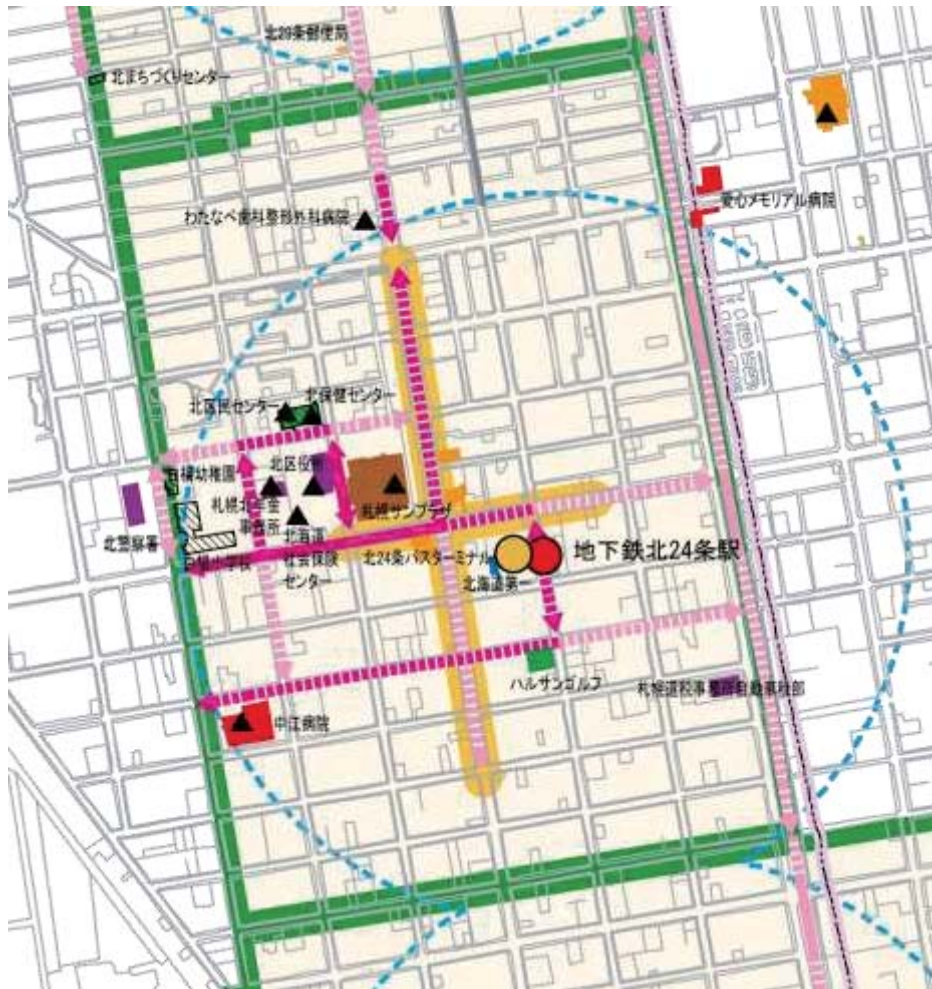
図 2-22 北 24 条地区