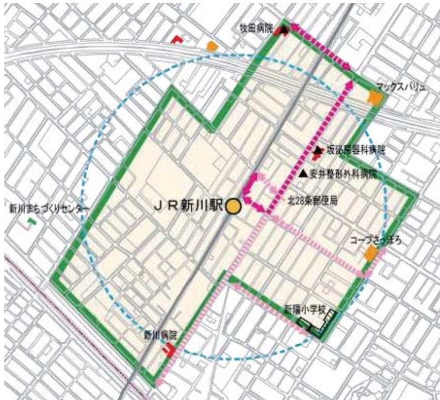
図 2-19 新川地区