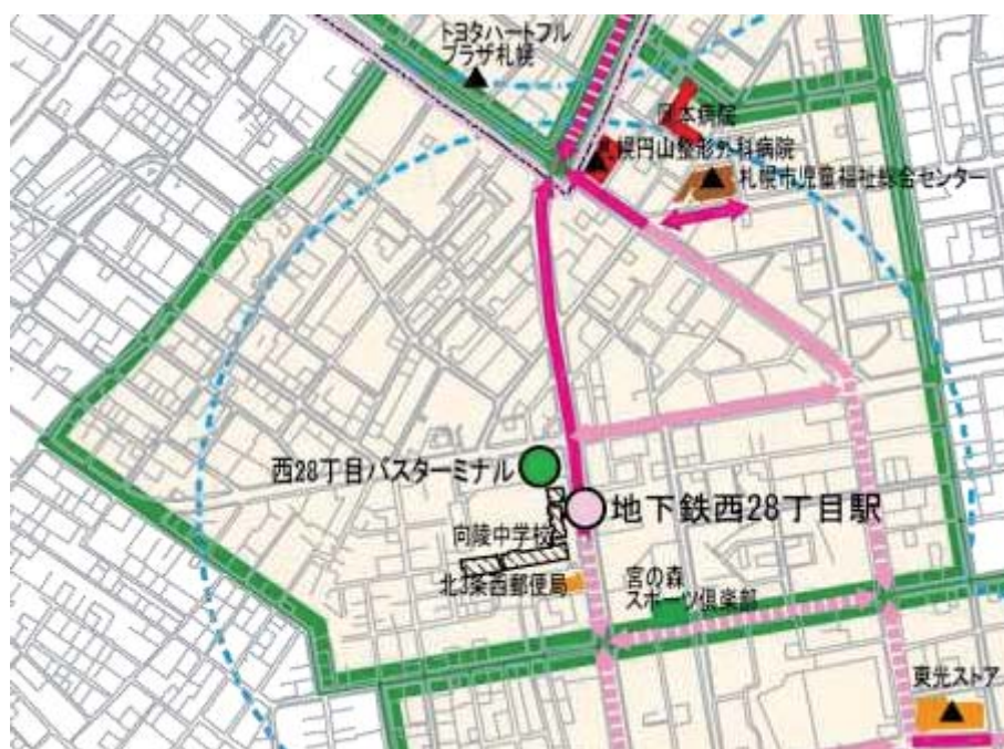
図 2-17 西 28 丁目地区