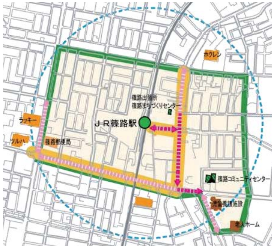
図 2-25 篠路地区