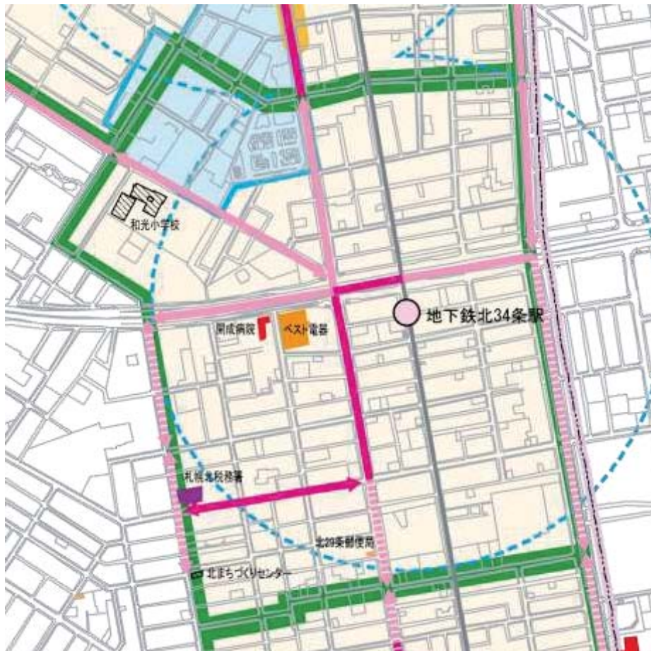
図 2-23 北 34 条地区