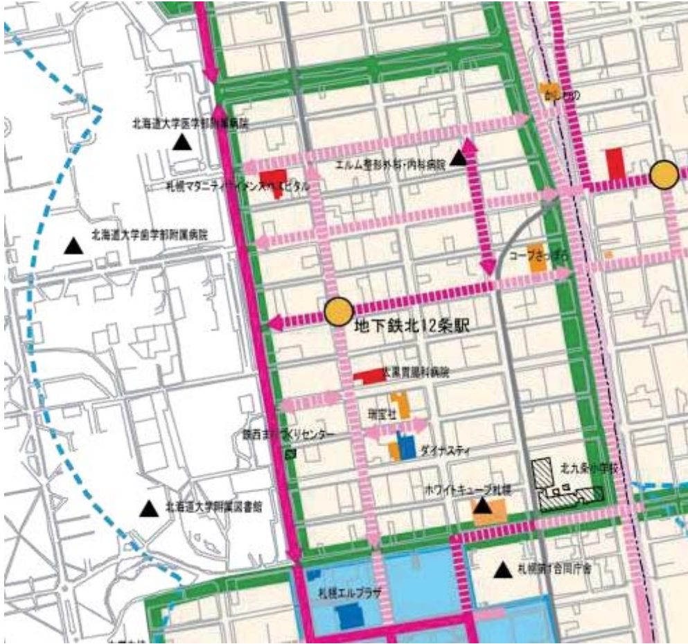
図 2-20 北 12 条地区