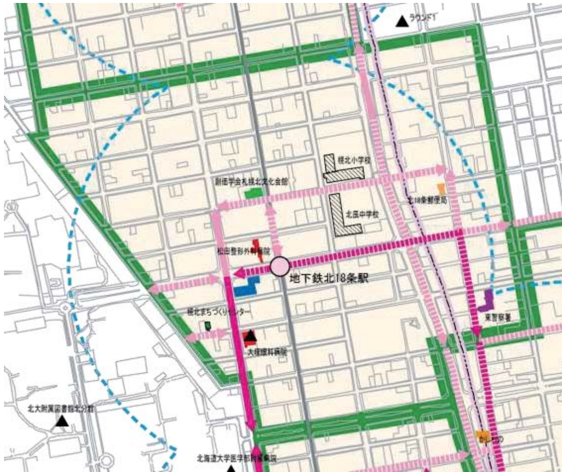
図 2-21 北 18 条地区