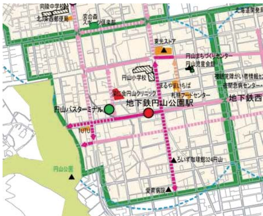
図 2-16 円山地区