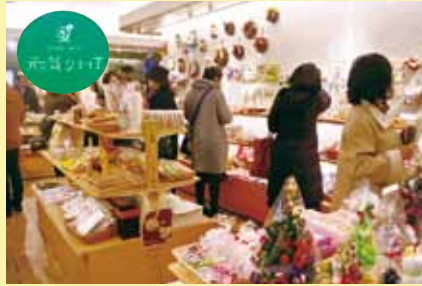
地下鉄南北線大通駅コンコース