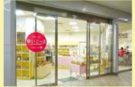
JR札幌駅西コンコース「食と観光の情報館」内