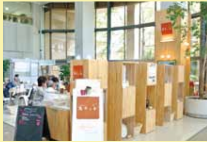
札幌市社会福祉総合センター1F(中央区大通西19丁目)