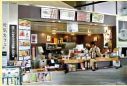
札幌市役所本庁舎1F(中央区北1条西2丁目)