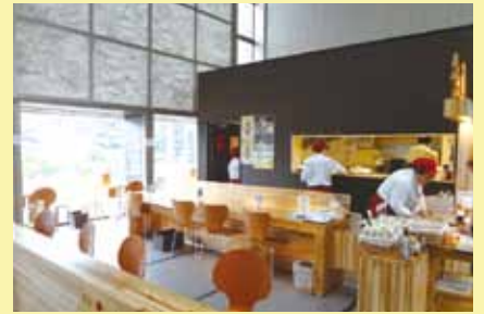
札幌市中央図書館(中央区南22条西13丁目)