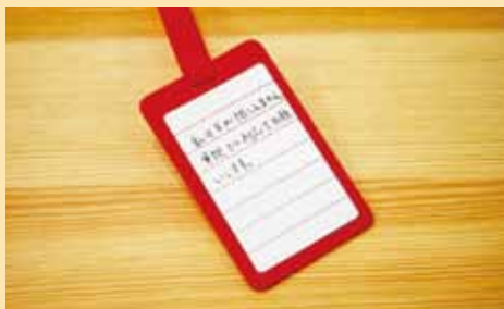
▲ 裏面にシールを貼り、必要な支援を書くことができます。