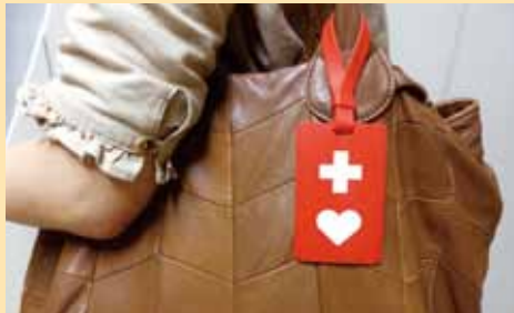
▲ 鞆などにつけられます。