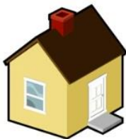
児童発達支援事業所