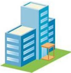
児童発達支援センター

児童発達支援とは、障害児につき、児童発達支援センター等に通わせ、日常生活における基本的な動作の指導、知識技能の付与、集団生活への適応訓練等の便宜を供与することをいう。