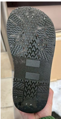
ケース2が使用していた靴底