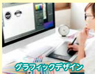
グラフィックデザイン

エクセル・ワード・パワーポイントを身に付け、データ作成やプレゼン資料を作ります。