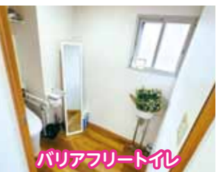
バリアフリートイレ