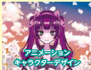
アニメーション キャラクターデザイン

専用の機材を使って、キャラクターやアニメの配色・構成・デザインをプロから学べます。