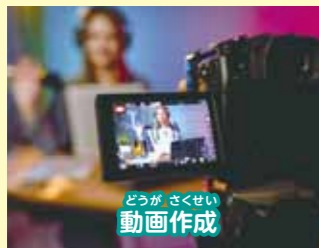
どうが さくせい 動画作成

好きなコースで学びながらスキルを身に付けていただけます。希望のコースが無い場合もお気軽にご相談ください。教材を用意したり、講師を連携したり、可能なかぎりサポートいたします。