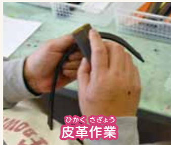
ひかく さぎょう 皮革作業