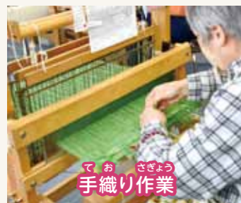
てお さぎょう 手織り作業