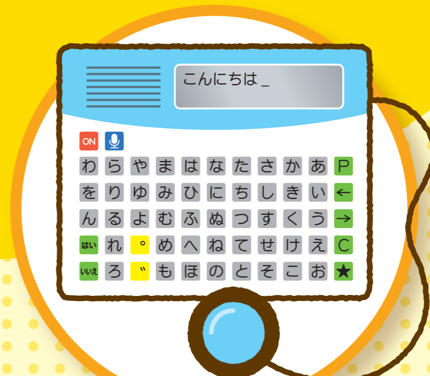
じゅう どの しょう しゃ よう 重度障がい者用 い し でん たつ そう ち 意思伝達装置