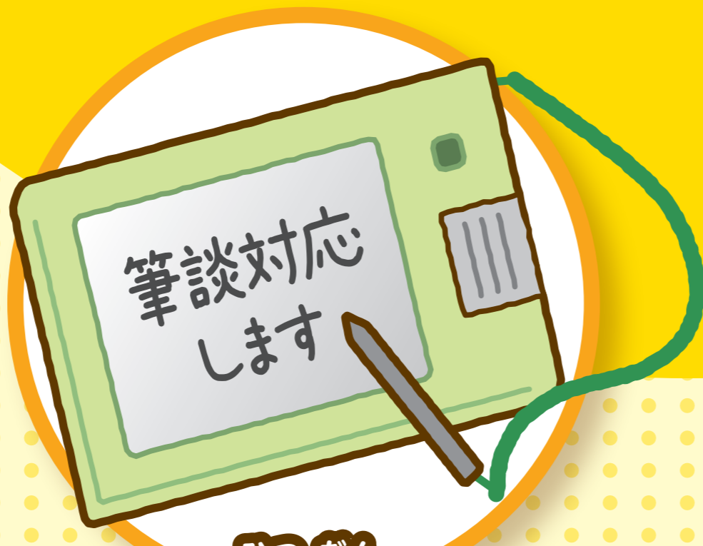
ひつ だん 筆談