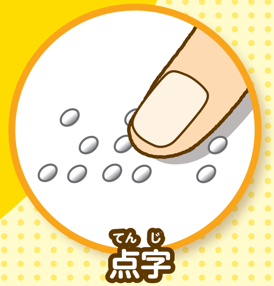
てん じ 点字