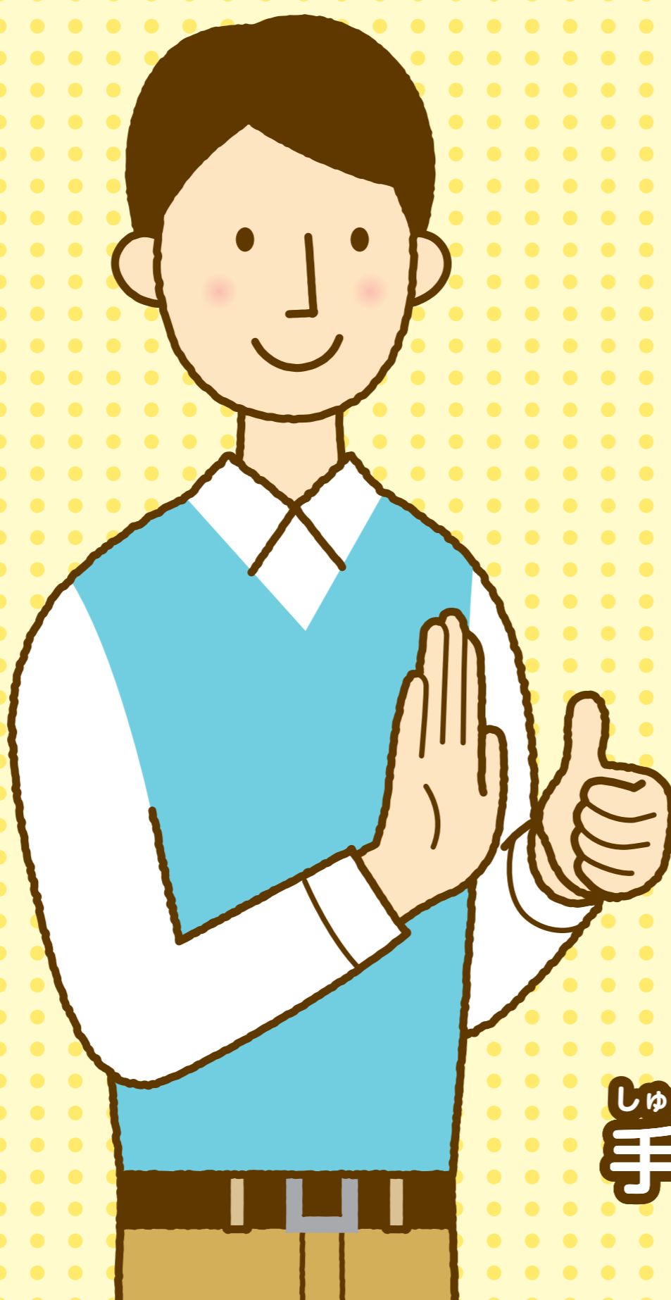
し ゅ わ 手話