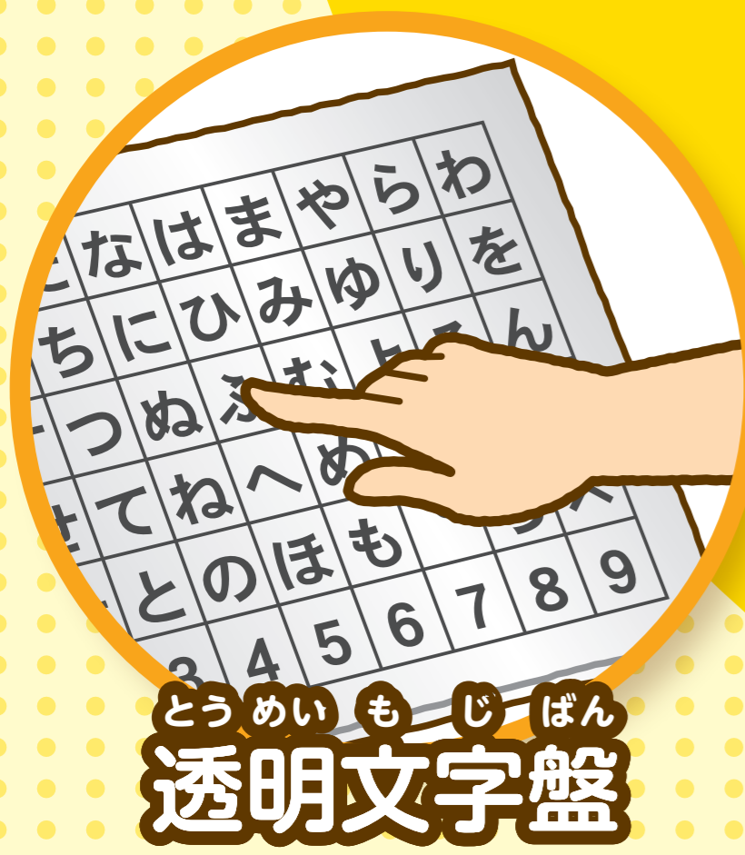
とうめい も じ ばん 透明文字盤