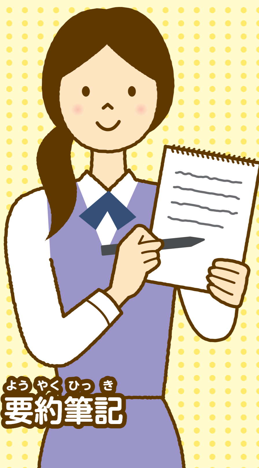
よう や く ひ つ き 要約筆記