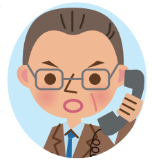
消防役 (指令管制員)