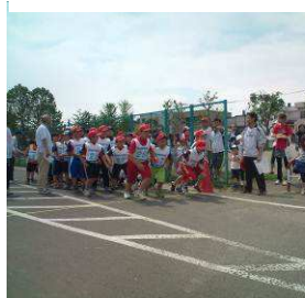
スタートする小学生