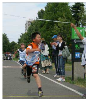
最後まで、全力疾走!

清々しい太陽のもと第21回白石東地区マラソン大会が、7月1日(日)白石東冒険公園を発着とした白石サイクリングロードをコースにして開催されました。