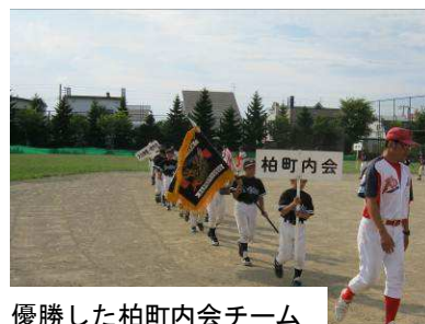
優勝した柏町内会チーム

また、各試合の審判やグラウンド整備などは、出場チームの指導者の方々のご協力をいただきました。ありがとうございました。