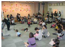
みんなでワイワイにぎやかに

毎月第3水曜日の午前10時から、白石東会館（本通18丁目南2-6）で子育てサロン「このゆびと～まれ！」を開催しています。毎回、たくさんの親子さんが集い、特に子育て中のお母さんたちの交流の場になっています。