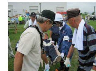
真剣に訓練に取り組む参加者