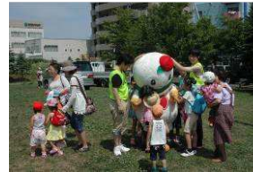
「しろっぴー」と子どもたち

遊びの内容は、ヨーヨーつりや洗濯ごっこなどの水遊び、竹馬やお手玉などの伝承遊び、赤ちゃんも遊べるハイハイ広場など盛りだくさんでした。また、近隣の東白石保育園、双葉保育園、柏葉保育園の園児さんによる歌や踊りのステージ発表や子どもたちに人気の「しろっぴー」の登場もありました。