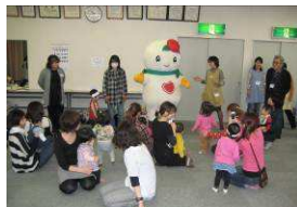
「しろっぴー」の登場にびっくり

スタッフとして地域の役員さんや子育てボランティアの方が毎回10名ほど担当され、親子さんと一緒におもちゃで遊んだり、折り紙やアンパンマン体操、絵本の読み聞かせなどを行っています。また、毎年12月はクリスマス会を開催し、サンタさんやトナカイさんが登場します。