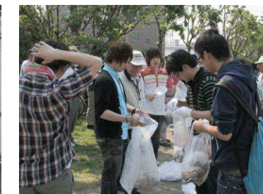
清掃活動中の学生の皆さん