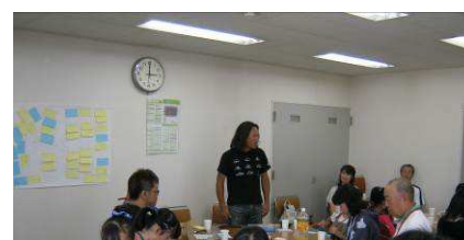
ワークショップの様子

21年と22年は、からまつトンネル(南郷通17丁目南)に「とんぼ そして 幸せの七つ星」、「私に繋がるすべてのものへ」を制作、23年は、向ヶ丘通トンネル(南郷通17丁目南)の南側壁面に「希望の子どもたち・・・未来」を制作、今年は、昨年と同じ向ヶ丘通トンネルの向かい側の北側壁面に、新たな壁画「明日へのラブレター」を完成させました。