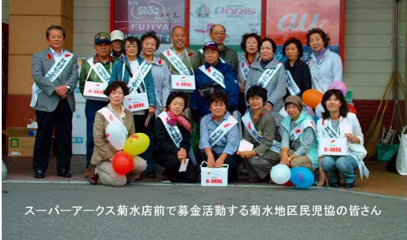
スーパーアークス菊水店前で募金活動する菊水地区民児協の皆さん