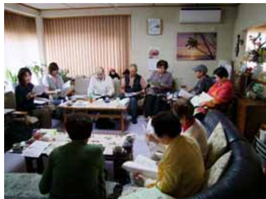
包括支援センターの方をお招きした勉強会