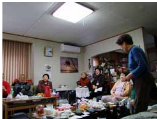
持ち寄り開いたささやかなクリスマスパーティ