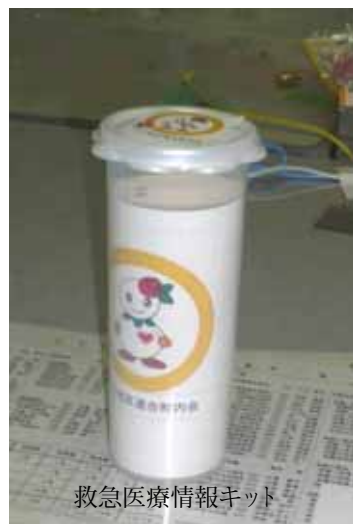
救急医療情報キット