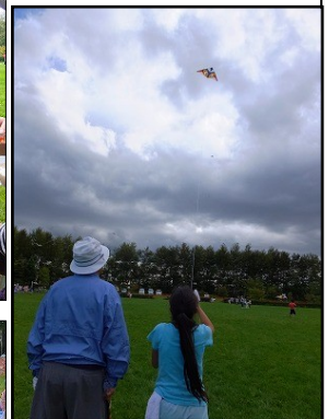
おじいちゃんと一緒に天高く揚がった凧 豚汁をいただいて楽しい昼食