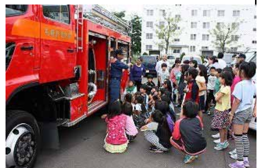
消防車の説明や消火器の説明もありました

その事を学習したとともに、集団行動の大切さも学ぶことが出来ました。それを生かして、生活していきたいです。