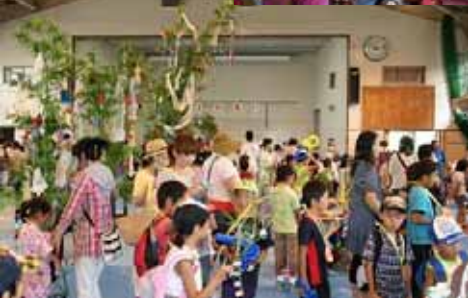
写真上 七夕〇×クイズ風景