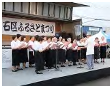
寿大学 卒業生の合唱