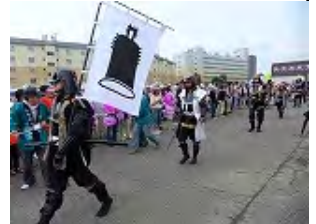
釣鐘の旗を先頭に入場