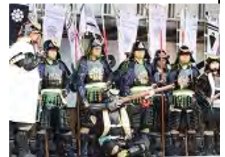
写真中 肩越しに撃つ

鉄砲の種類も多くあるが、今回のは銃身が少し短い物だそうで写真中のは馬上から打つための細見の小型の銃だそうです。