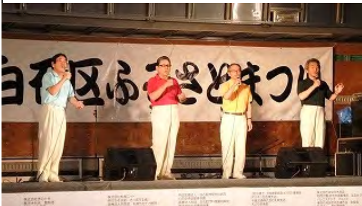
最後は 男性コーラス「ダンディー・フォー」の皆さん