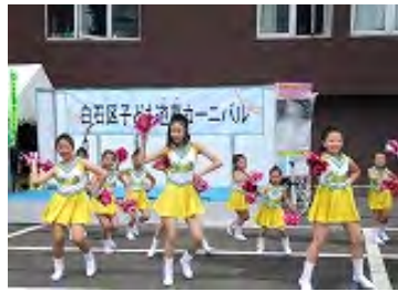
遊芽カーニバルに参加の 皆さん