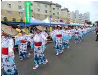
おなじみ「白石音頭」 会場の周りを踊りました