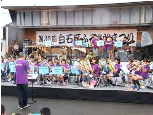
川北小学校 金管バンドの 皆さんの演奏

ちょうど、この演奏のあたりから雨が降ってきまして、皆さん濡れながらの演奏でした。 お父さんも傘の下でビデオを撮っていましたよ。