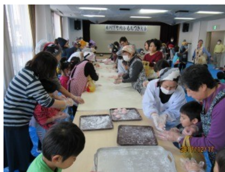
私もつきました（写真上）