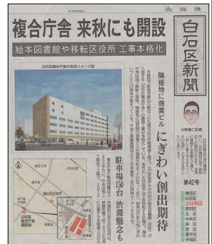
4/21道新記事が伝える新庁舎記事

一番遠くなる東川下からは南郷7丁目バスから地下鉄に乗り換えなくてはならず、往復の交通費は660円もかかる。南郷7丁目行を地下鉄白石行へと延長し乗り換えなし210円で行けるように要望します。交通網の整備もぜひお考え下さい。