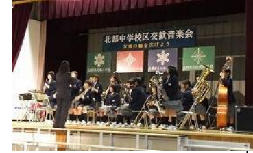
北都中吹奏楽部演奏 3 0 名