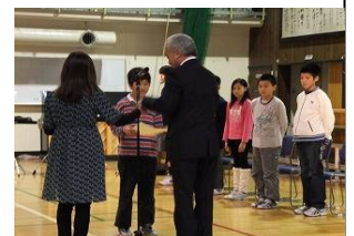
標語表彰式の様子

神様がくれた命は大切に 不注意で大事な命失うな 夕方も危険がいっぱいライト ON それでいい命が たばこでけずれてく ちょっとまで信号無視は事故の もと ふざけてたそしたら友だち事故にあう 横断 中油断してたら危険だよ 集団で帰れば不審者出てこない あめあげるついていけない そのこえに 朝早くみんなを 見守る地域の目 挨拶はみんな をつなぐ合言葉 この町を 守っていこう全員で。