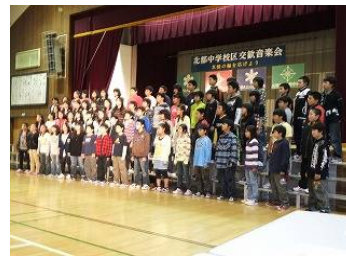
北都小 6 年生合唱 6 9 名

川北小 5 年生の合奏 1 4 3 名 東川下小 5 年生合唱 6 1 名 続いて、東川下小は 5 年生 6 1 名の合唱、北都小 6 年生 6 9 名の合唱と、共に 2 曲づつ 歌われました。 北都中では合唱コンクールの最優秀学級から 1 年 6 組 と 2 年 5 組が少し大人の声での合唱を披露しました。