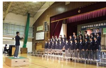
北都中 2 年 5 組 金賞学級