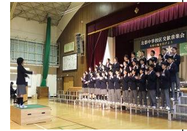
北都中 1 年 6 組 金賞学級