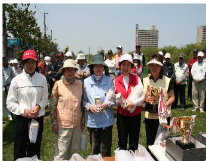
写真5月23日例会での女子上位入賞者