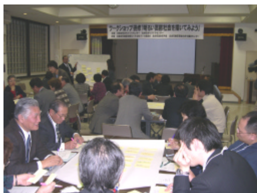
グループで話が弾むワークショップの様子。

3月18日、19日の両日、北東白石と北白石のまちづくりセンター主催で、ワークショップ研修「明るい高齢社会を描いてみよう」を開催しました。