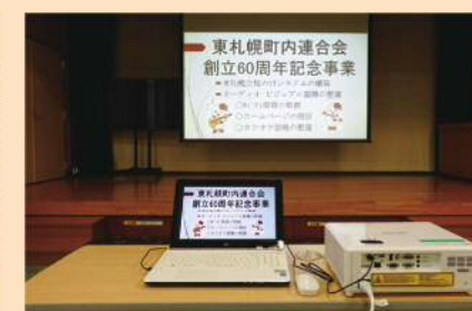
パソコンプロジェクター