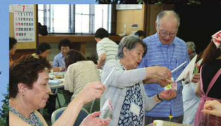
ランチサロン 通常第四金曜日