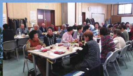
クラブ友の会 通常毎週火曜日