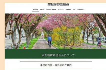
町連のホームページ画面