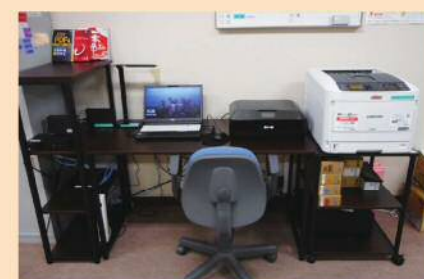
ネットワークパソコン(福まち室)