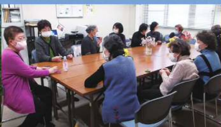
ふれあいいいきサロン 「やまびこ」東札幌 通常毎週水曜日