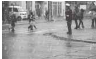
小田商店前交差点

新入学児童への交通安全指導を交通安全指導員・札幌白石交通安全協会・母の会・小学校PTAの皆さんで東札幌地区区内で6ヶ所に分かれ4月8日の入学式から4月15日の期間で行われました。