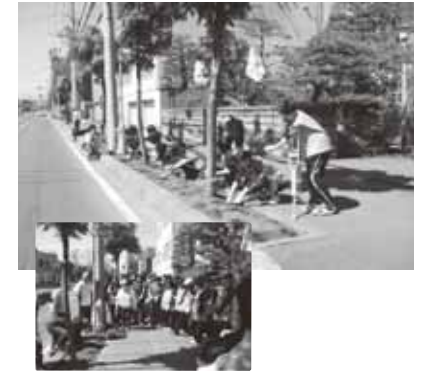
各部会の活動報告