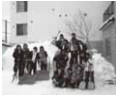
日章中ボランティア除雪(1月26日)

1月26日(土)に、東札幌の高齢者宅5軒の除雪を日章中の生徒さんが行う事業に対して支援を行いました。除雪ボランティアに参加された生徒さんが74名、教員、役員41名で5軒の家を手分けして、それぞれ除雪道具を持参し、約1時間の作業を行いました。生徒のなかには、初めて除雪をする生徒もいて、いい経験になったようです。各家庭のみなさんも大変喜んでいただきました。平成25年度もみなさまに喜ばれる事業を行ってまいります。