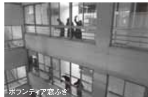
ボランティア窓ふき