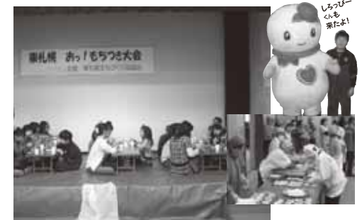
しゅっぴー くも 来たよ!