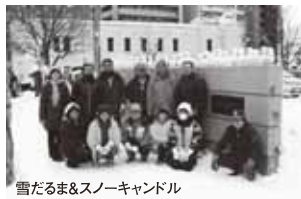
雪だるま&スノーキャンドル