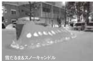
雪だるま&スノーキャンドル