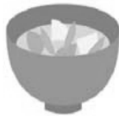
具だくさんの みそ汁