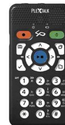
プレクストーク リンクポケット