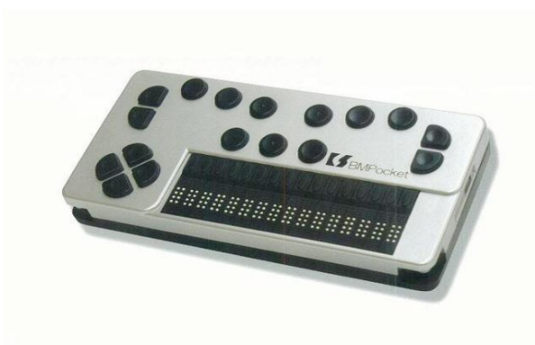
ブレイルメモポケット