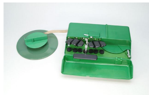
プリスタ点字速記用タイプ