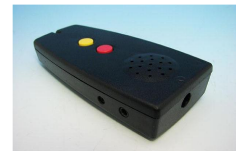
色判別装置 カラーイーノ