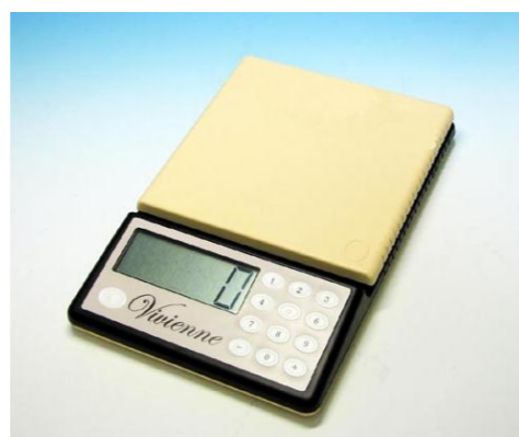
音声キッチンスケール ビビアン