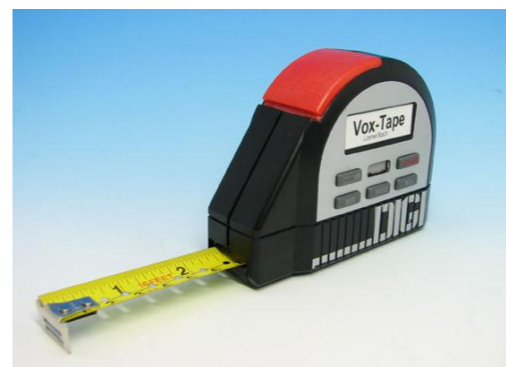
音声メジャー VOXテープ