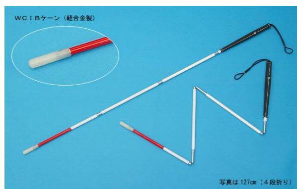
盲人用安全杖 (補装具)

その他 パソコン・スキャナ・視覚障害体験キット・点字絵本などを展示しています