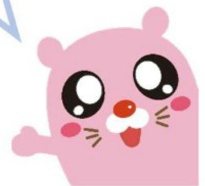
さぽーとほっと基金公式キャラクター キャッピー