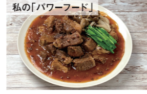
私の「パワーフード」 まちづくり活動を支える「チカラの源」を紹介 プレミアホテル-CABIN-札幌 レストラン「ハレル」 『美蘭牛の四川風唐辛子煮込み』 札幌市中央区南5条西7丁目 TEL.011-213-1301

中央区のアダプト・プログラムに参加して街のゴミ拾い活動を実施(右)また、札幌マラソンのスタッフにボランティアで参加したり(上)、大通公園の花壇の植え込みなどを行っている。