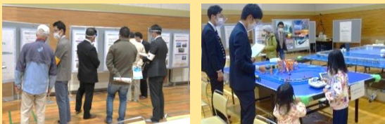
写真はオープンハウス(第1回)の様子です

自由な雰囲気、日頃感じている疑問や意見を職員がお伺いいたします。 ご都合の良い時間にお越しください。