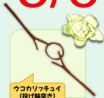
ウコリフチュイ (投げ輪突き)