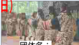
団体名： アンコラチメノコウタラ