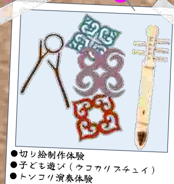
●切り絵制作体験 ●子ども遊び(ウコカリスチユイ) ●トンコリ演奏体験