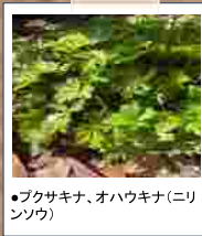
●フクサキナ、オハウキナ(ニリンソウ)

※実施内容、スケジュールは都合により変更になる場合があります。最新情報はHP等でご確認ください。