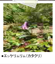
●エシケリムリム(カタクリ)