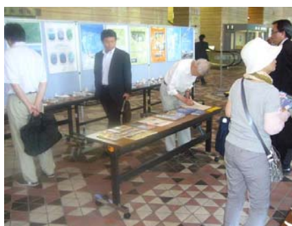
市役所ロビーパネル展の様子

ビジネスや医療、また観光など道民の生活の足として重要な役割を担っている丘珠空港が、今後も多くの方々に利用されるように、市役所ロビーにおいて同空港の利便性や