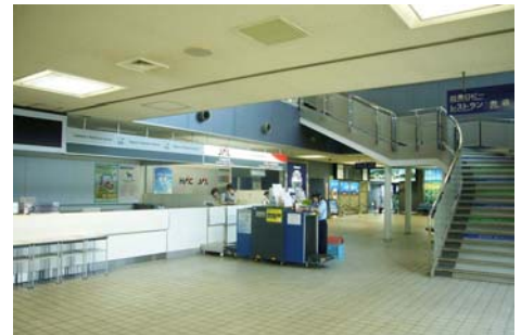
ANAの表示もなくなり時間帯によっては閑散とした光景も見られた出発カウンター

現在、HACは5年連続の経常赤字を出しており、経営分析を行い今後このまま新千歳を拠点として続けていくのか、丘珠に拠点を移すのか、検討を行っています。