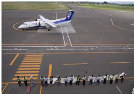
職員に見送られ出発するANA最終便

現在、こうしたことについての課題解決に向け、北海道と札幌市で協議を行っているところです。