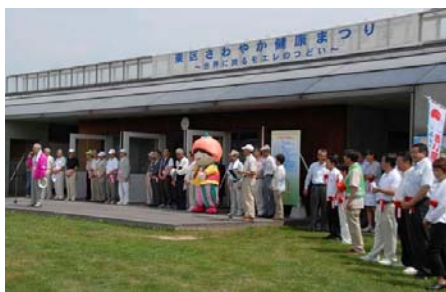
東区さわやか健康まつり開会式

元である東区町内会の大勢の方々に、丘珠空港をPRするリーフレットとメモ帳を配布し、丘珠空港の利便性をあらためてPRさせていただきました。