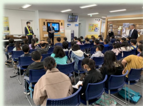
<栄小学校4年生による空港見学>