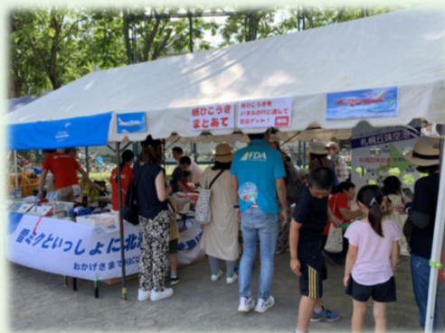
<ハッチふれあいフェスティバル>

令和6年度もこれまで以上に、丘珠空港や周辺エリアの活性化に取り組んでまいりますので、ご協力よろしくお願い申し上げます。