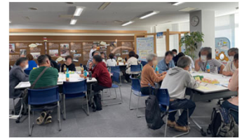
< 昨年のワークショップの様子 >

そこで、まちづくり構想に対するご意見やアイデア等を幅広くいただきたく、ワークショップを下記のとおり開催いたします。ぜひご参加いただき、まちづくりの方向性や取組などに関するご意見をお聞かせください。