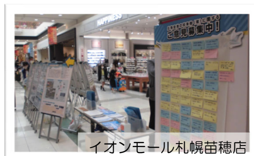
イオンモール札幌苗穂店