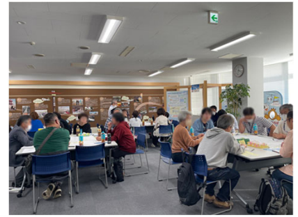
＜ワークショップの様子＞

今後の予定として、幅広いテーマで行う意見交換会も下記のとおり開催していきますので、ご参加ください。