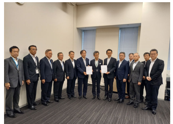
<要望書提出時の様子>

このような状況を踏まえ、 令和5年8月31日に国土交通省と防衛省に対し、丘珠空港の機能強化の柱となる滑走路延伸について、最短と考えられる『2030年供用開始に向けた早期事業化』などの要望 を実施しました。