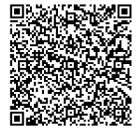
根室中標津線について