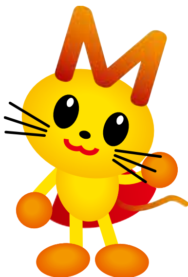
まちづくり応援キャラクター 「まっちゃん」