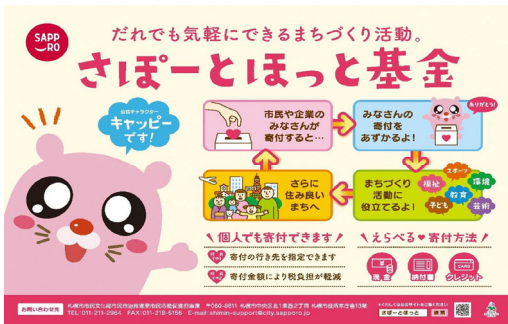
さぽーとほっと基金