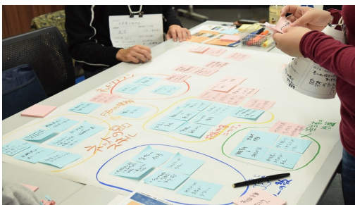
町内会活動活性化に向けた意見交換会