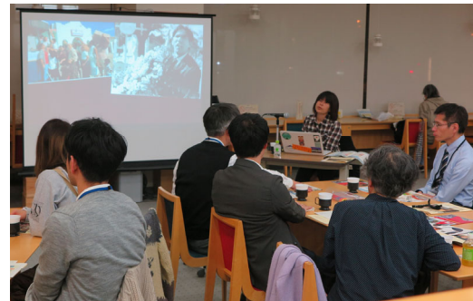
市民へ市民まちづくり活動を紹介 (市民活動サポートセンター)