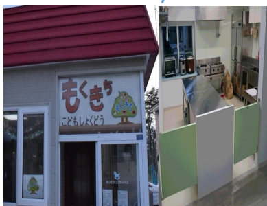
空き家をコミュニティハウスへ改修