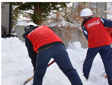
企業・大学の連携による除雪ボランティア