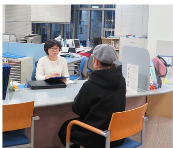
市民活動サポートセンターによる活動団体に対する相談業務

まちづくり活動情報サポートサイトへの登録団体数 3,000 団体 (2023 年度) ※2017 年度 2,758 団体