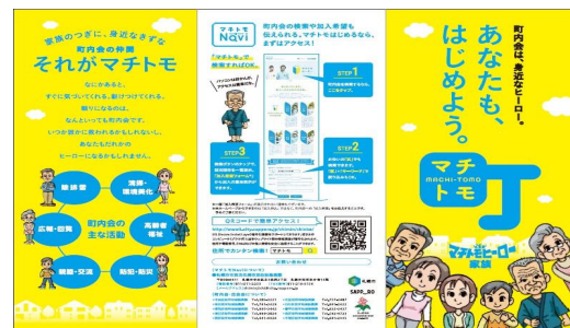
リーフレットによる広報