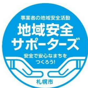
地域安全サポーターズ シンボルマーク