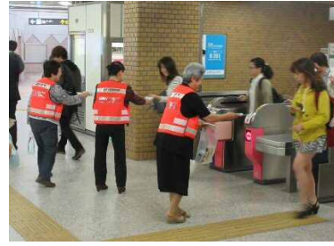
啓発の様様（豊平区）