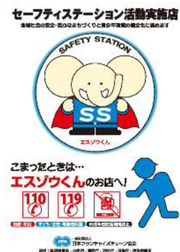
日本フランチャイズチェーン協会 セーフティステーションポスター