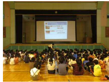
子どものための防犯教室