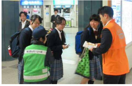
啓発の様様（白石区）