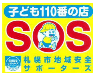
地域安全サポーターズ 子ども 110 番の店