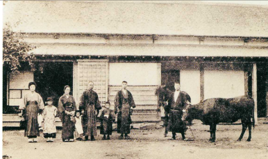
明治40年、黒岩家住宅前(旧棟)