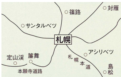
札幌附近の通行屋等の位置図(明治初期)