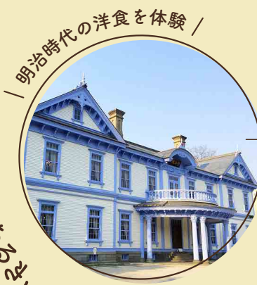
明治時代の洋食を体験！

ストーリー 演劇人が語る、まちの物語。札幌の昔がみえる、やさしく深いまちあるきツアー