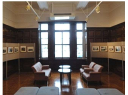
大通交流ギャラリー