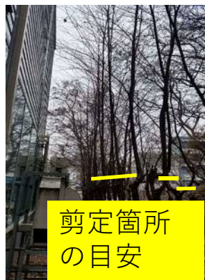
豊平館附属棟北側 約70本の剪定を行う