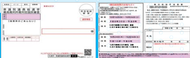
札幌市内にお住いの方に届くはがきの見本