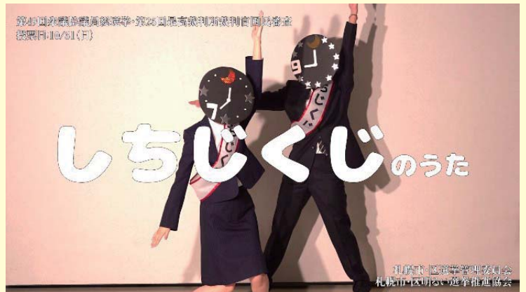
分散投票を呼び掛ける動画 「しちじくじのうた」

令和4年に執行される第26回参議院議員通 常選挙においても、安全に投票できる取組み を続けていきます。